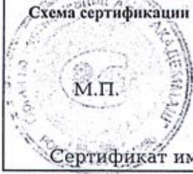
Схема сертификации З.

ГОСТ Р 50460-92 наносится на корпус изделия и (или) в эксплуатационную документацию.